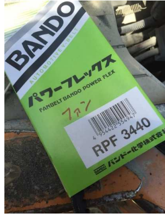
ウォーターポンプベルト